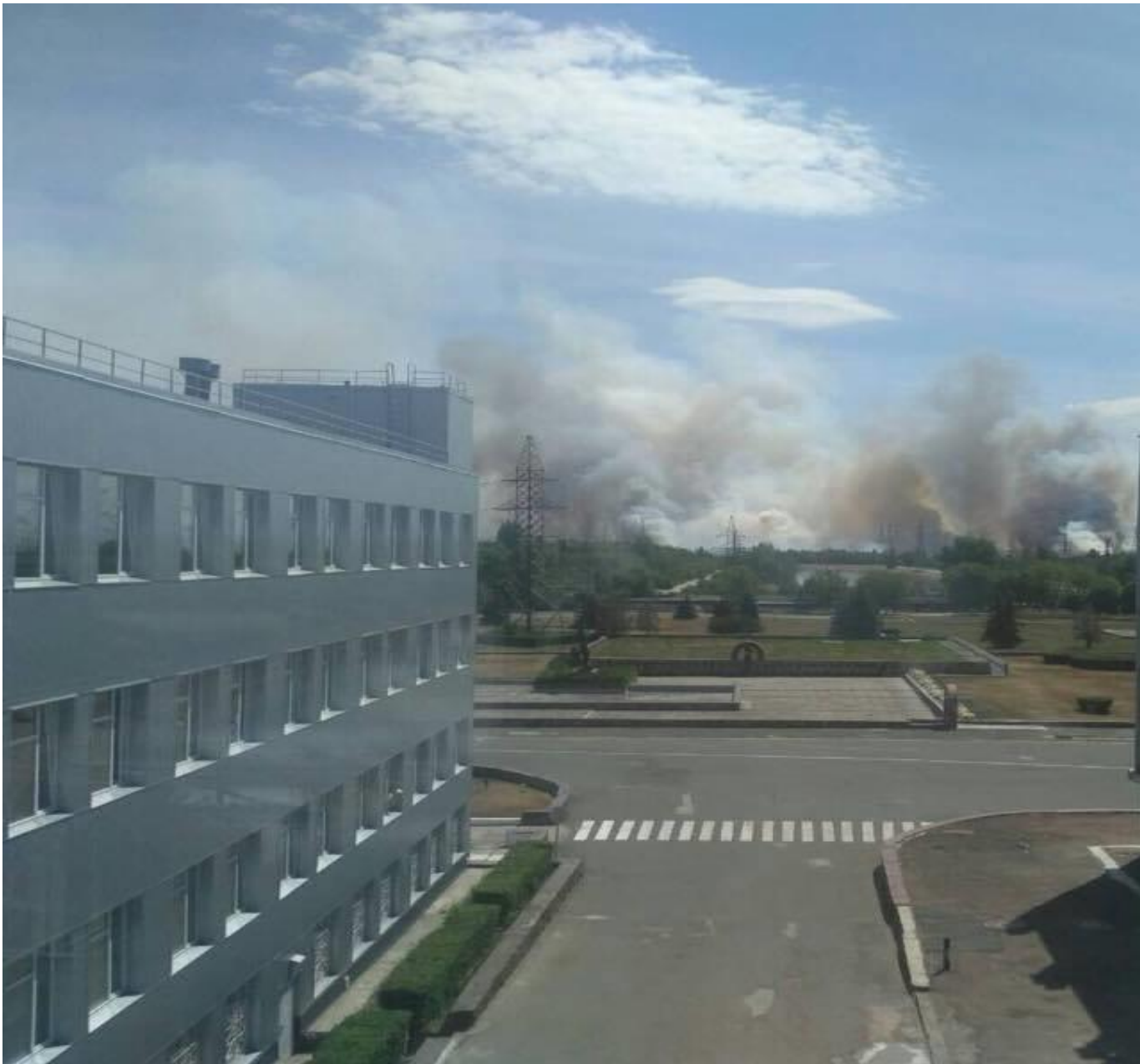
Фото пожара

В городе Чернобыль уровень радиации во время пожара составляет 24,1 микрорентген в час