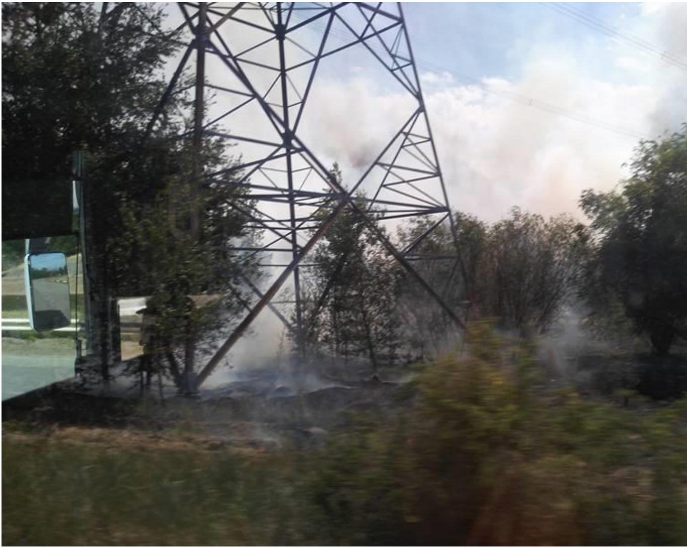
Задымление в Чернобыльской зоне

На пожар направили 11-ю Государственную пожарно-спасательную часть по охране ГСП ЧАЭС