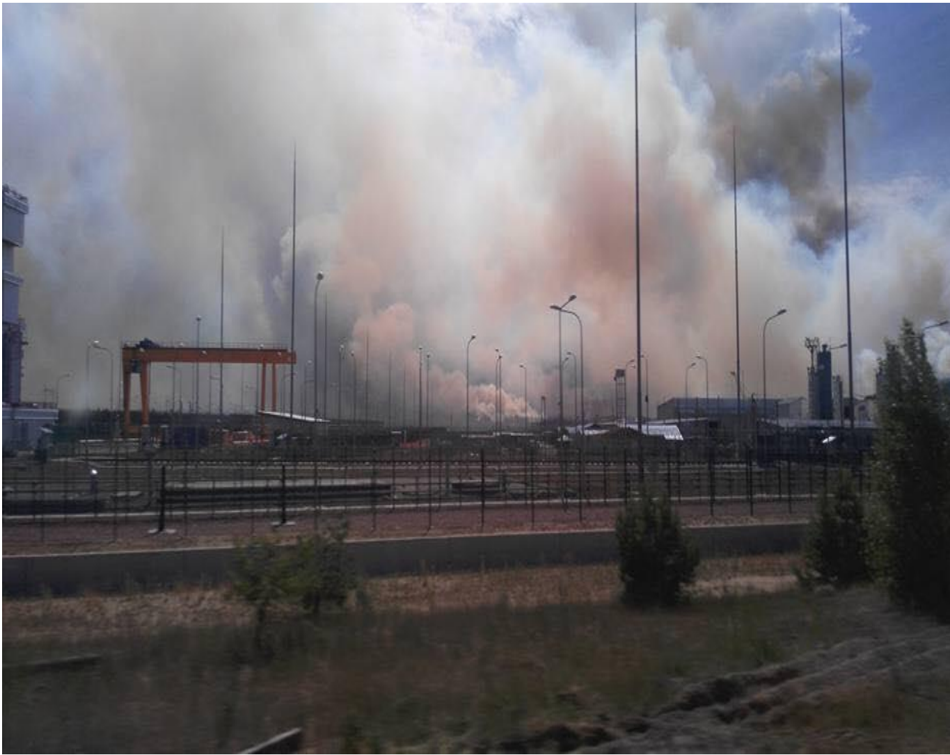
Facebook Татьяны Высоцкой