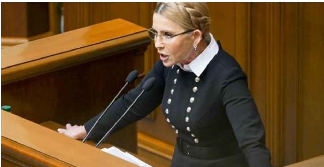
Юлия Тимошенко в парламенте

"Порошенко не видать второго срока", - заявила Юлия Тимошенко. После поражений на президентских выборах 2010 и 2014 года она снова в числе фаворитов